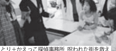
とり+かえって探偵事務所 呪われた街を救え