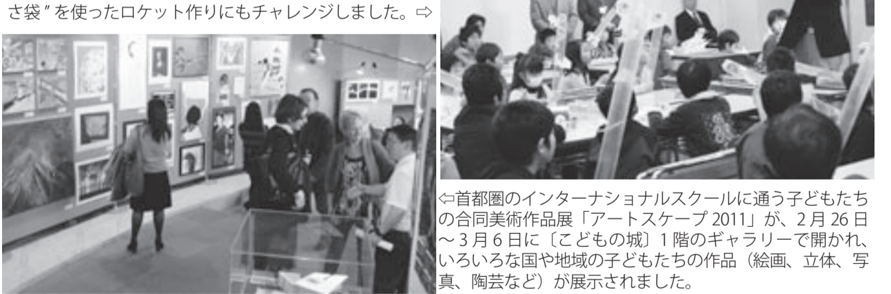
首都圏のインターナショナルスクールに通う子どもたちの合同美術作品展「アートのスケール2011」が、2月26日～3月6日に〔こどもの城〕1階のギャラリーで開かれ、いろいろな国や地域の子どもたちの作品(絵画、立体、写真、陶芸など)が展示されました。