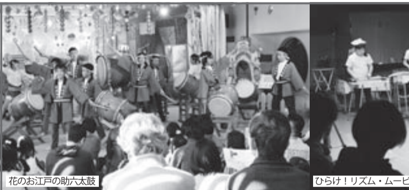
花のお江戸の助六太鼓

10 回目を迎える東京国際和太鼓コンテスト(本選)が、8月27日(組太鼓青少年の部)と28日(大太鼓の部・組太鼓一般の部)に青山劇場で開催されます。10回目を迎えて、全部門の課題曲が新しくなります。コンテスト参加者を募集しています。応募資格は、国籍・性別は問いませんが、本選に参加できる人。大太鼓の部は高校生以上、組太鼓の部は1チーム5人以上12人以内で、