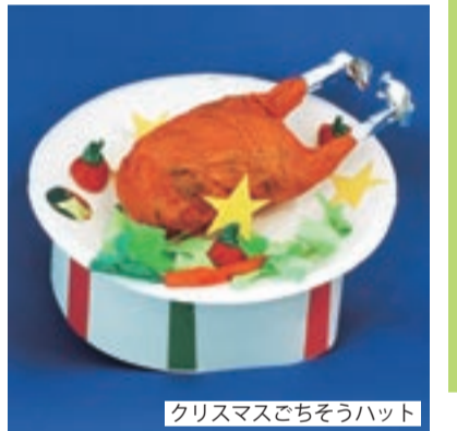
クリスマスごちそうハット