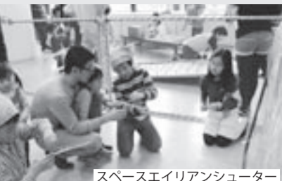
スペースエイリアンシューター