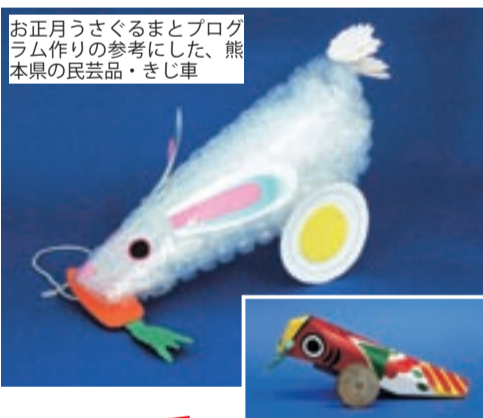
お正月うさぎとプログラム作りの参考に、熊本県の民芸品・きし車