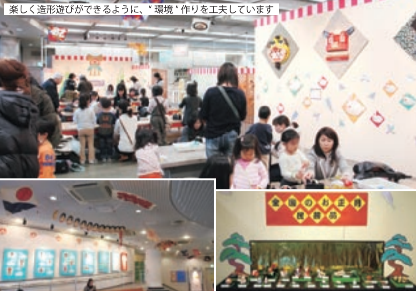
楽しく造形遊びができるように、“環境”作りを工夫しています

造形活動とおして季節の行事に親しむ《こども歳時記》を行っています。お正月といえば〇〇〇、節分といえば□□□—というように、季節の行事と結びつく“もの”を思い浮かべ、それを手がかりに造形遊びを楽しむ、“つくってあそぶ”プログラムです。