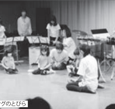
ひらけ!リズム・ムービングのどひら

【東京国際和太鼓コンテスト事務局】 東京新聞事業局文化事業部 〒100-8505 東京都千代田区内幸町2-1-4 電話：03-6910-2345 ファクス：03-3503-1438 E-mail: taiko@tokyo-np.co.jp http://www.tokyo-np.co.jp/event/taiko/